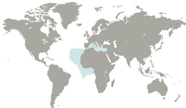
Figuur 1 vangstgebied Dorade

De goudbrasem komt voor in zowel zoet, zout als brak water, waar hij zich voedt met macrofauna (kevers, slakken, wormen, larven, etc.) en visjes. Hij leeft in scholen, dichtbij de bodem langs de kust van de Middellandse Zee, in Het Kanaal en de Atlantische Oceaan. Hij komt als zomergast in de Noordzee.